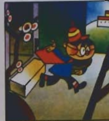
2. Signorino, come vuole, dica presto: « Che ci vuole? »