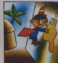
8. Attilio afferra non onore sfurra un occhio di rigore