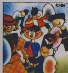
9. e quel tale « che se tutto » fa la Pasque e becco esulto