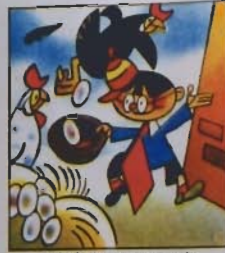
3. E davvero è una trovata, requisisce la covata