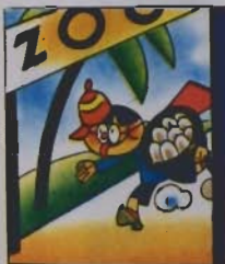
4. « Se allo stesso, sto a vedere, tutto l'uovo faccio bere, »