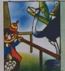
5. mi scodella, fresco fresco, un ovano gigantesco ».