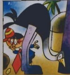
6. Ma la bestia, per la cura, cresce solo e dimisura