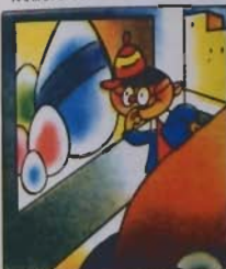
1. Che bell'ovio, e come grosso, verdi, giallo, azzurre e rosse!

PUBBLICITÀ Ufficio Pubblicità de "Il Balilla" ROMA - Viale del R. N. 16 - Tel. 580552 CONTO CORRENTE POSTALE 18 APRILE 1935 - XII