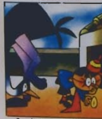
7. e depone un ovelino, dopo appena di un pulcino